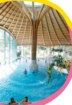
Solemar, Bad Dürkheim