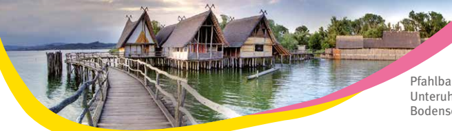
Pfahlbaumuseum Unteruhldingen, Bodensee